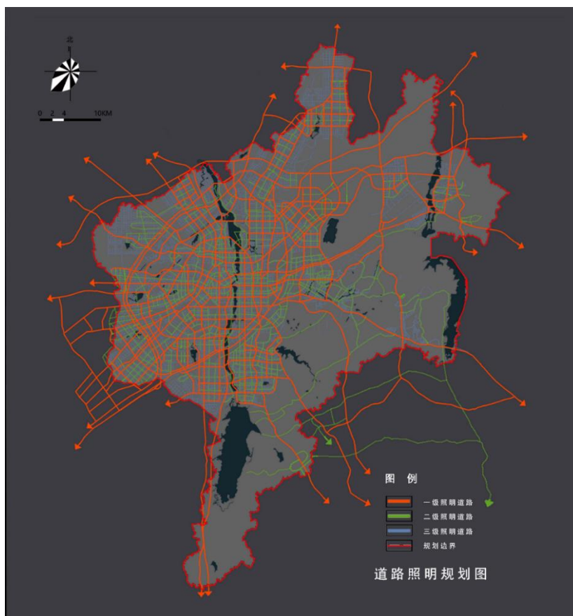
图 3：道路照明规划图